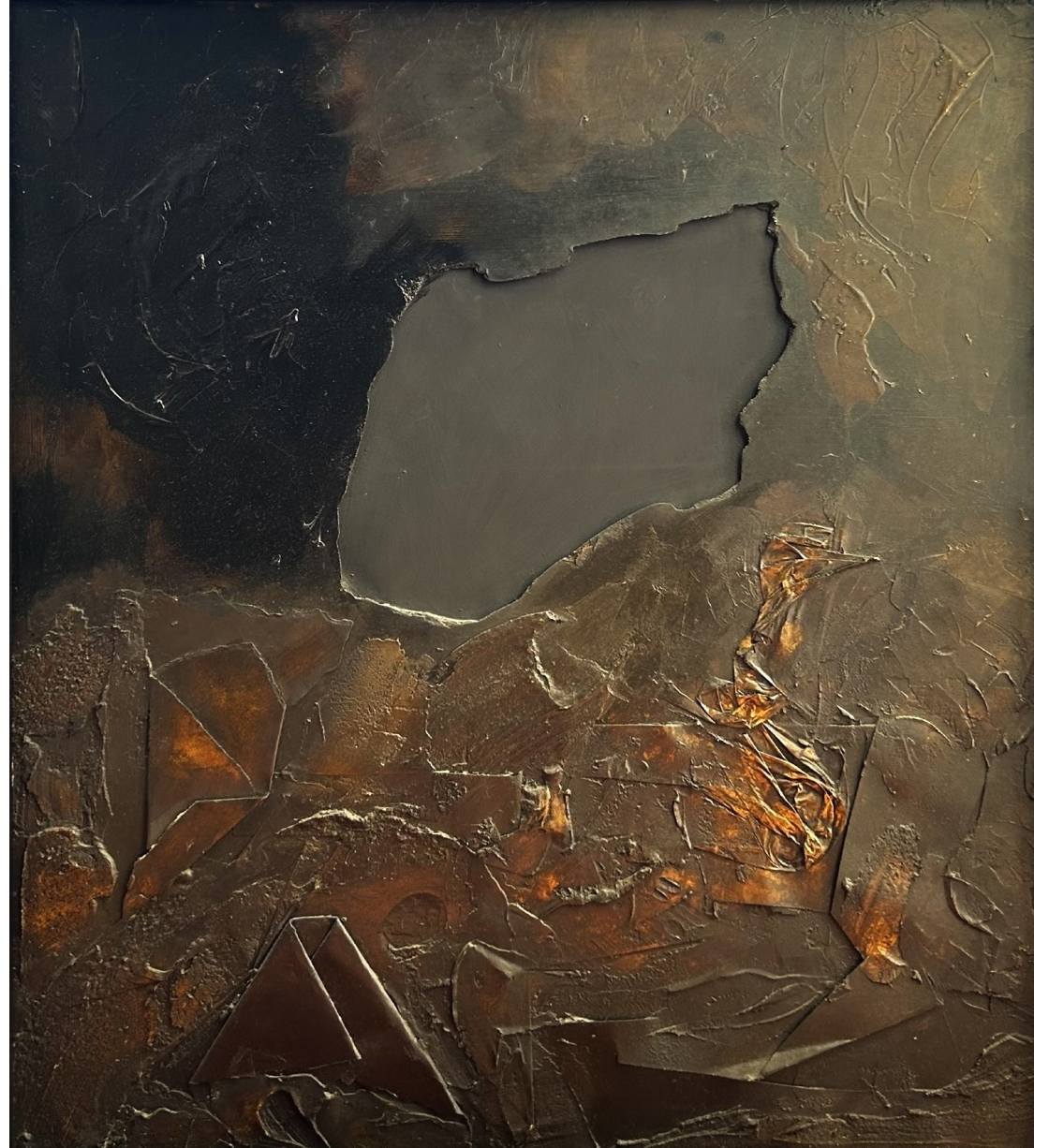
GUINOVART. Sense títol, 1963. Tècnica mixta sobre tàblex 67'5x60'5 cm.

ACTIVITAT REALITZADA AMB LA COL-LABORACIÓ DE