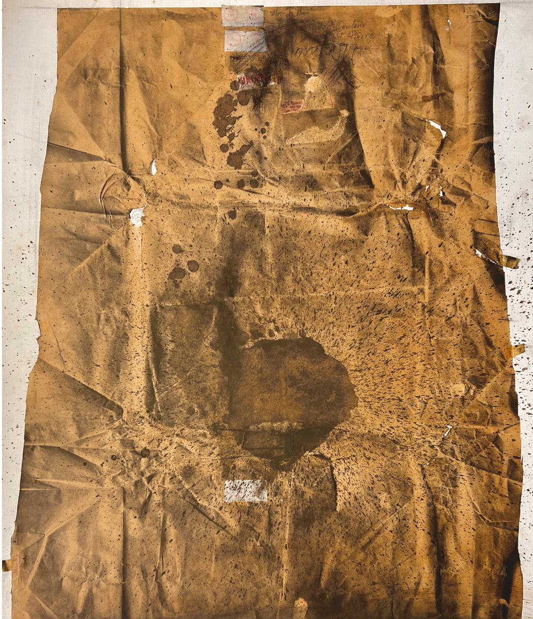
ANTONI CLAVÉ. La tâche d'encre, 1976-1977. Tècnica mixta i collage sobre tela 116 X 89 cm.