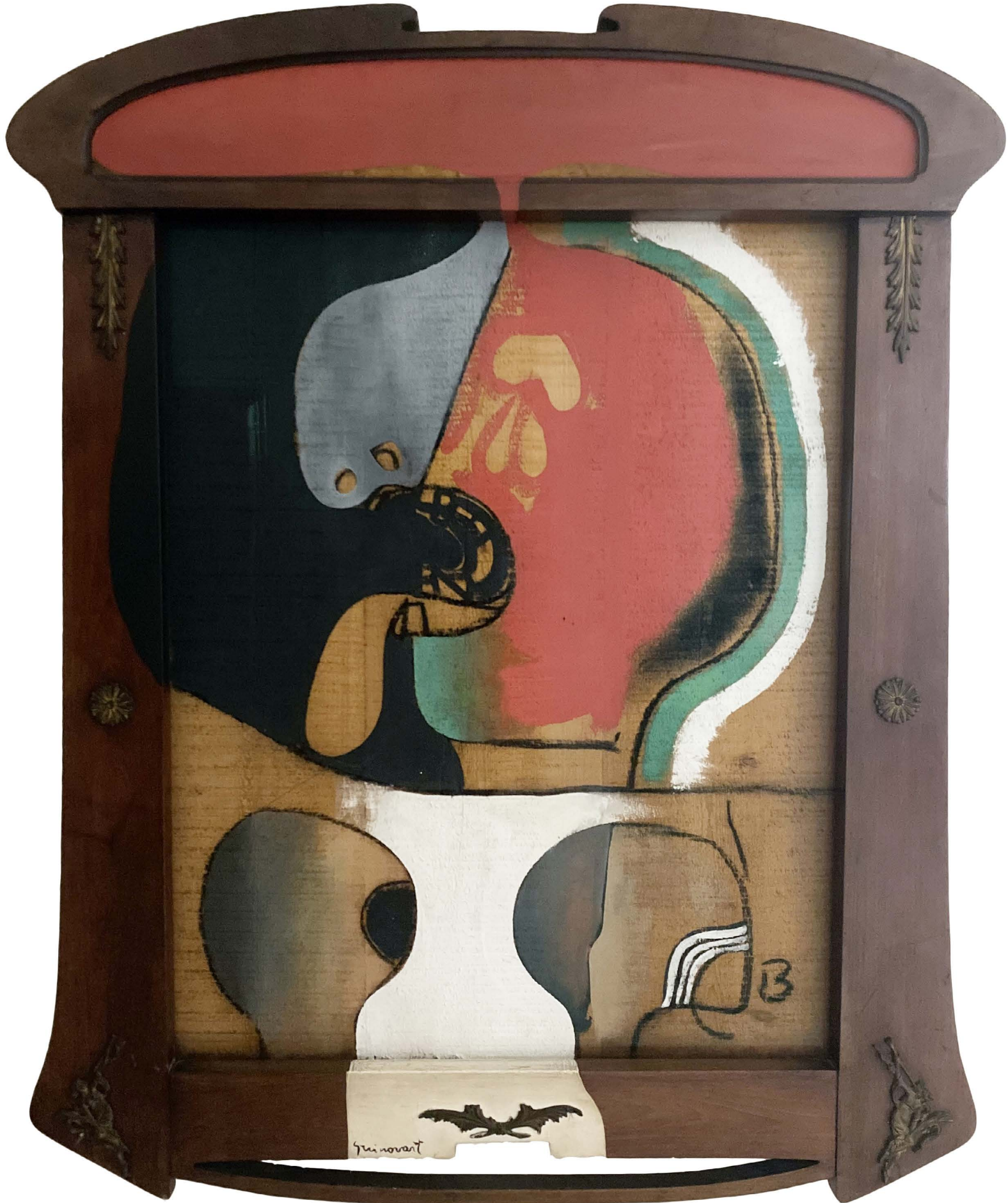
La llengua, 1970. Oli sobre fusta 86x62 cm. Josep Guinovart © VEGAP 2021

ACTIVITAT REALITZADA AMB LA COL-LABORACIÓ DE