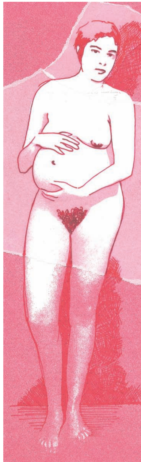
Dona 2. Olga Cortadelles