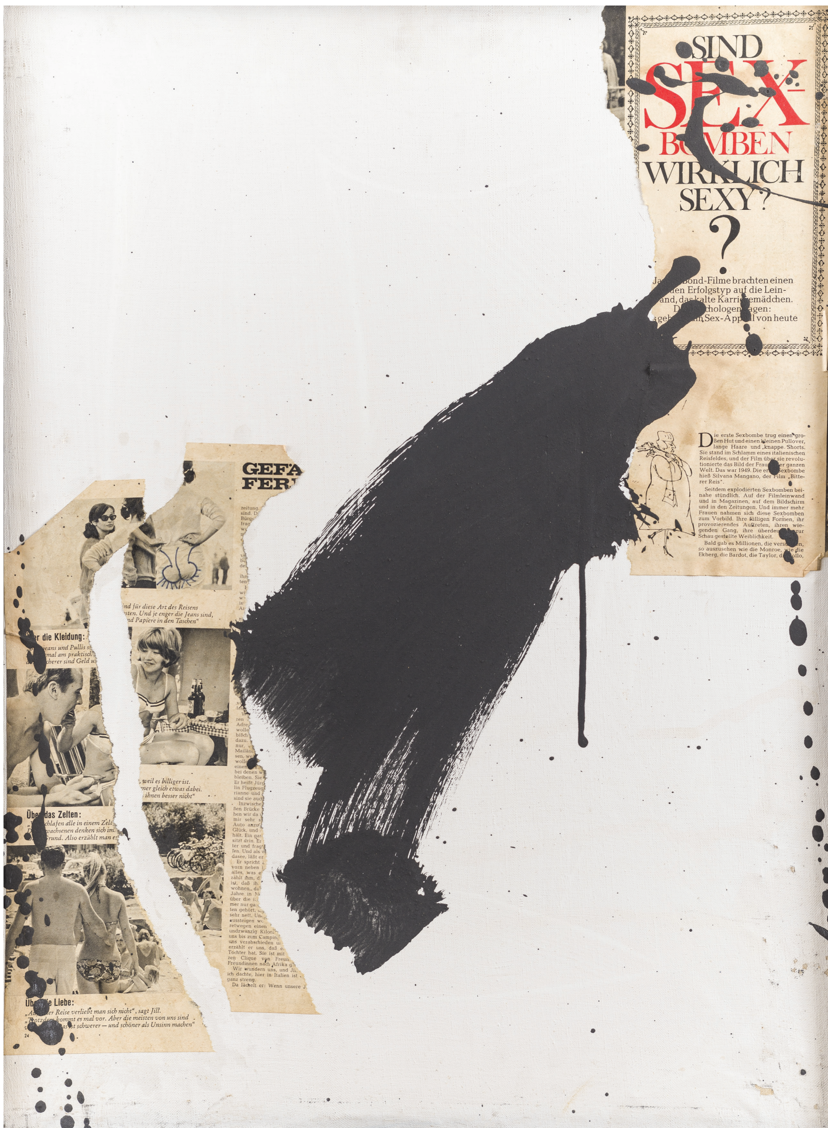
Romà Vallès. Collage, sèrie: El mundo roto, 1965

ACTIVITAT REALITZADA AMB LA COL-LABORACIÓ DE