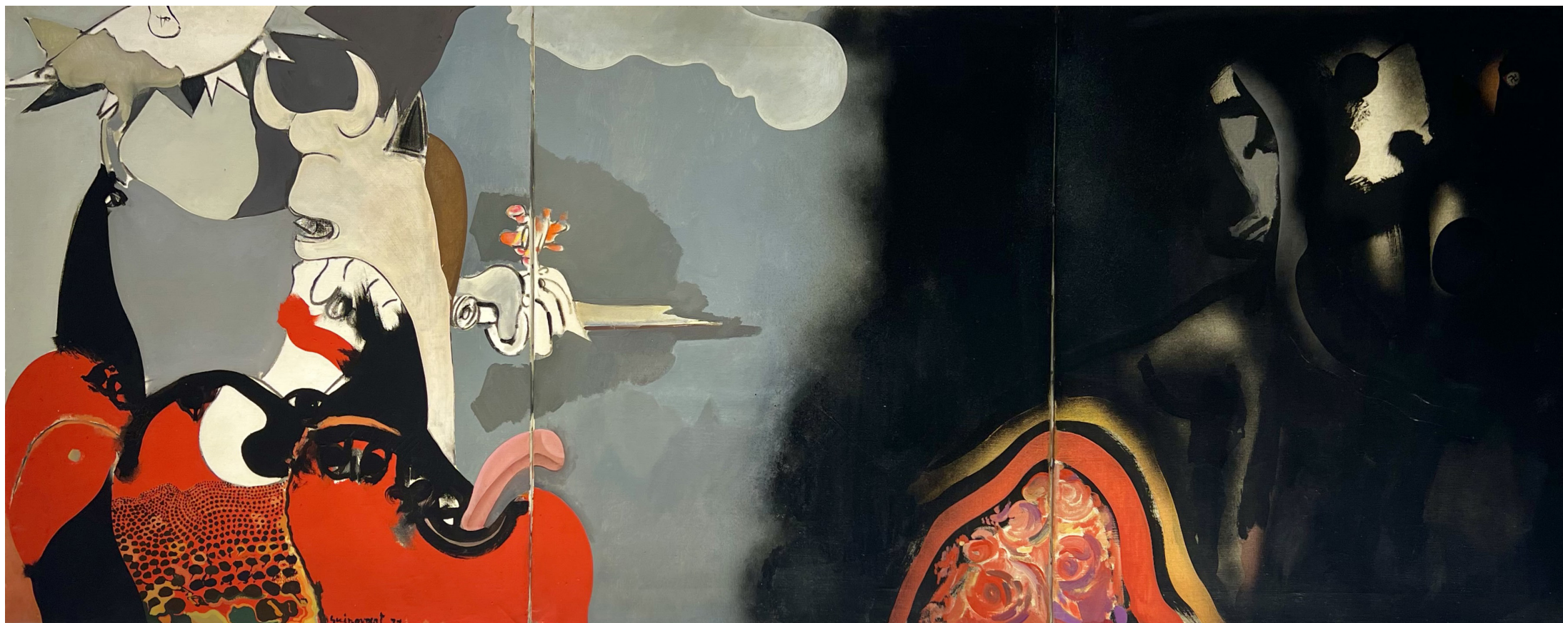
1971. Des de la nit. Acrílic i collage sobre tela 65x162 cm. Col. Particular. Vegap 2023

ACTIVITAT REALITZADA AMB LA COL-LABORACIÓ DE