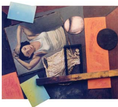
Tela pintada, fusta, acrílic i oli / any 2004 / 140 cm x 155 cm x 6 cm