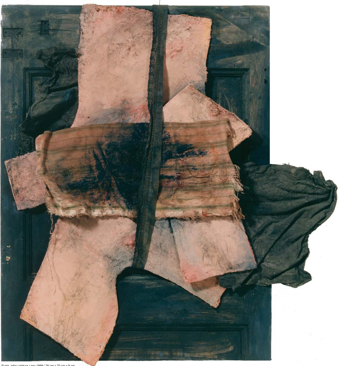
Fusta, roba i pintura / any 1999 / 76 cm x 70 cm x 8 cm